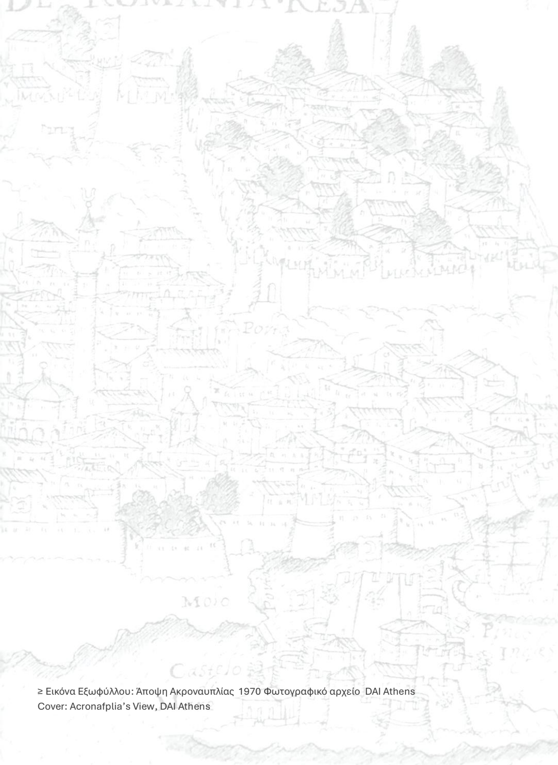
≧ Εικόνα Εξωφύλλου: Άποψη Ακροναυπτίας 1970 Cover: Acronauplia's View